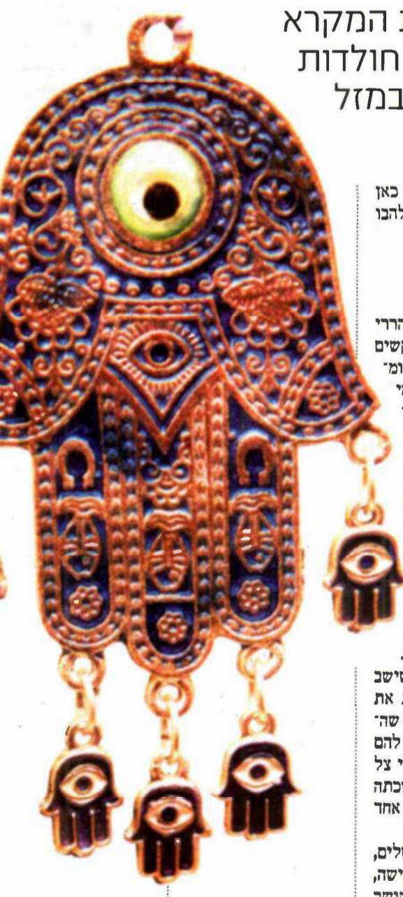
חמסות מורגניות לצד קלפים עתיקים

כשברחובות הסמוכים קבצנים מוכרים סרט אדום בשקל, במוזיאון ארצות המקרא בירושלים מציגים את היסטוריית ה"נגד עין הרע" של העם היהודי. צואת חולדות לרפואה שלמה, פסלים למציאת זוגיות ולחשים נגד אימפוטנציה. שיהיה במזל