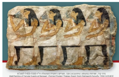
ציור קיר, אזורית בתוסה | סיוס בצבוי | תנ"י, תחילת | ראשית השושלת ה-18 | 1425-1550 לפנה"ס Wall Painting of Female Guests at Banquet | Painted Plaster | Thebes, Egypt | Early Eighteenth Dynasty, 1550-1425 BCE